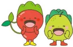
山形地方法務局マスコットキャラクター やっほーず