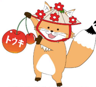
不動産登記推進イメージキャラクター 山形ご当地トウキツネ