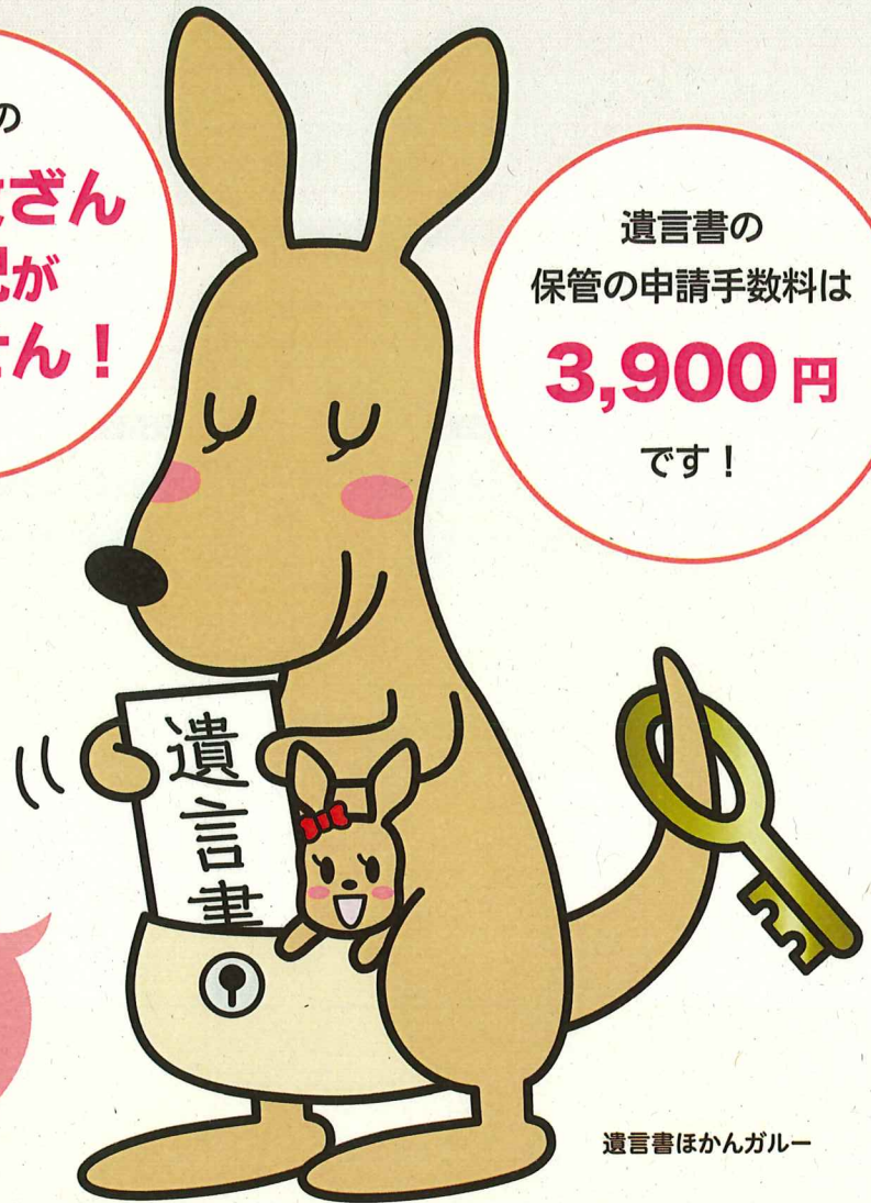
遺言書ほかんガルー