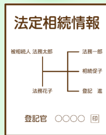
法定相続情報一覧図