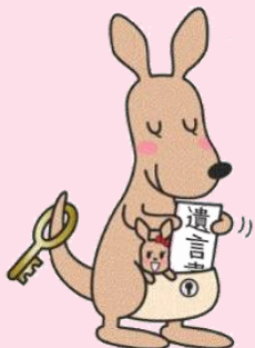
遺言書ほかんガルー

遺言書の内容については、 法律の専門家への相談 をお願いします。 遺言書保管申請の手続や書式は、 法務省ホームページ をご覧ください。