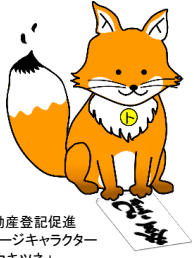
不動産登記促進 イメージキャラクター 「トウキツネ」