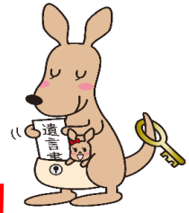
遺言書ほかんガルー

富山地方法務局では、 自筆証書遺言書保管制度 や 相続登記 について、皆様のもとにうかがう 出前講座 を行っています（ 無料 ）。 出前講座 で、法務局の職員と一緒に、身近な制度について学びませんか。