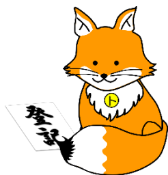
不動産登記推進イメージキャラクター 「トウキツネ」

エンディングノートとは、自分自身に何かあったときに備えて、ご家族が様々な判断や手続きを進める際に必要な情報を残すためのノートです。また、生活の備忘録として、そして、これまでの人生を振り返り、これからの人生を考えるきっかけ作りにするものです。