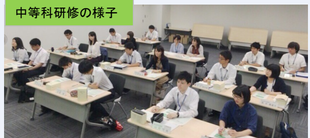
中等科研修の様子

また、本人の能力や希望等により、他県の法務局や法務本省に異動することもあります。