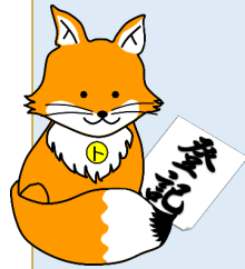
不動産登記推進 イメージキャラクター 「トウキツネ」