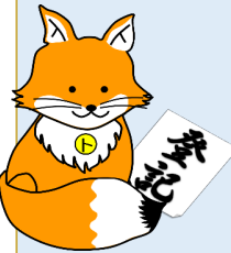
不動産登記推進 イメージキャラクター 「トウキツネ」

司法書士による 無料相談会 を行います。 この機会に、法務局でできる相続登記や自筆証書遺言書の保管に関する手続き等について、ご相談してみませんか？ 注） 申請書等の作成・チェックは行うことができませんのであらかじめご了承ください。