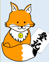
不動産登記推進 イメージキャラクター 「トウキツネ」

注）申請書等の作成・チェックは行うことができませんのであらかじめご了承ください。