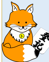
不動産登記推進 イメージキャラクター 「トウキツネ」