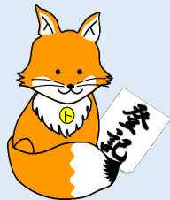
不動産登記推進 イメージキャラクター 「トウキツネ」