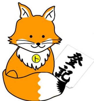
不動産登記推進イメージキャラクター 「トウキツネ」