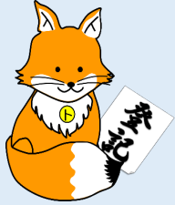
不動産登記推進 イメージキャラクター 「トウキツネ」