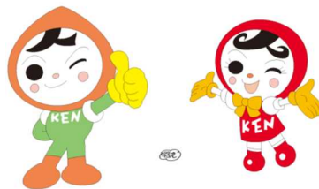
人権イメージキャラクター 人KENまもる君・人KENあゆみちゃん