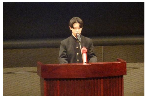
朗読をする受賞者 (徳島地方法務局長賞)