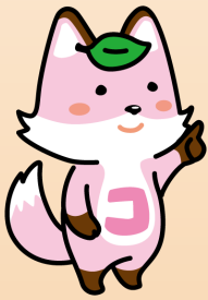
戸籍制度 マスコットキャラクター 「コセキツネ」