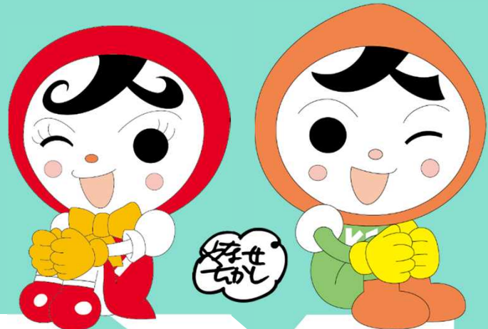
人権イメージキャラクター 「人 KEN あゆみちゃん」