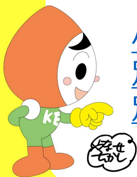
人権イメージキャラクター 「人 KEN まもる君」

小学生人権標語コンテスト実施要領(PDF) 別紙(1)作品一覧表 別紙(2)※協議会用※応募校一覧