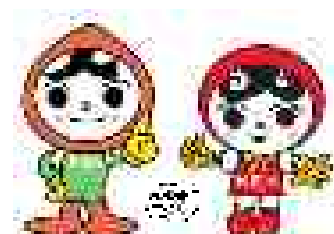
人権イメージキャラクター 「人KENまもる君」