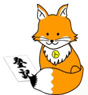
不動産登記推進 キャラクター 「トウキツネ」