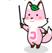
戸籍制度マスコット キャラクター 「コセキツネ」