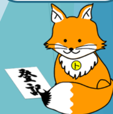
不動産登記推進キャラクター「トウキツネ」

法務局ではこれらの制度が国民に定着し、利用されるよう制度の周知にも取り組んでいます。