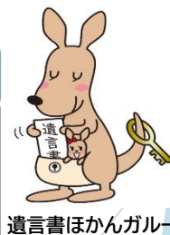
遺言書ほかんガル