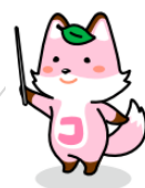
戸籍制度マスコットキャラクター「コセキツネ」

法務局ではこれらの制度が国民に定着し、利用されるよう制度の周知にも取り組んでいます。