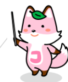
戸籍制度マスコットキャラクター「コセキツネ」

法務局ではこれらの制度が国民に定着し、利用されるよう制度の周知にも取り組んでいます。