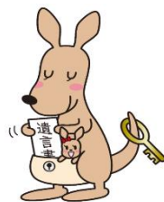
遺言書保管ガルー