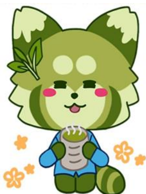
静岡地方法務局 マスコットキャラクター しずほっち