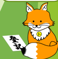
不動産登記推進キャラクター「トウキツネ」

法務局ではこれらの制度が国民に定着し、利用されるよう制度の周知にも取り組んでいます。