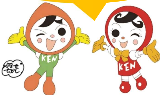
人権イメージキャラクター 人KENまもる君・人KENあゆみちゃん

公式LINEでは、本局・支局・出張所で行う最新イベントの発信をしています。是非チェックしてください！