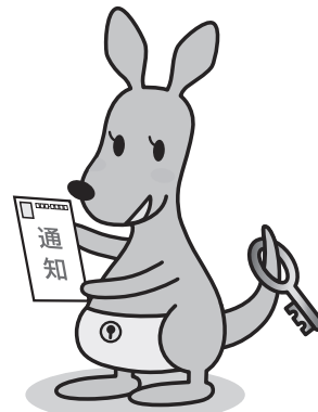
遺言書はかんガルー

預けて安心!自筆証書遺言書保管制度とは あなたの遺言をきちんと伝えるための制度です。