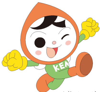
人権イメージ キャラクター 人KENまもる君