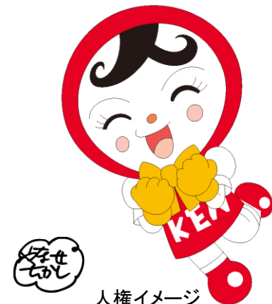
人権イメージ キャラクター 人KENあゆみちゃん