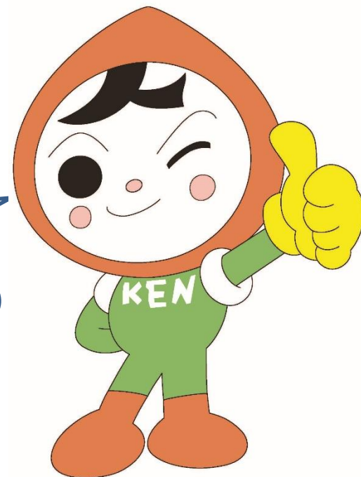
人権イメージ キャラクター 人KENまもる君

ご協力いただきました皆様、ありがとうございました。また、来年も皆様とこのような実りある啓発活動ができることを楽しみにしています。