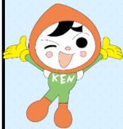
人権イメージキャラクター 人KENまる君