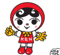
人権イメージキャラクター 人KENおゆみちゃん