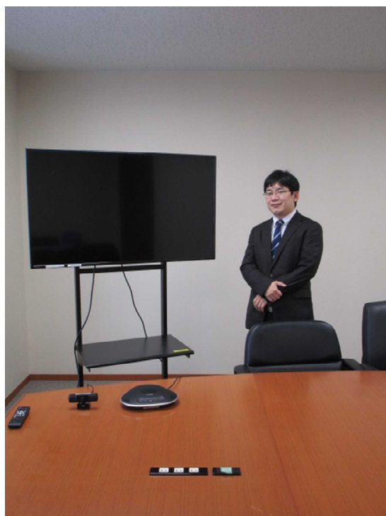
〈ラウンドテーブル法廷〉