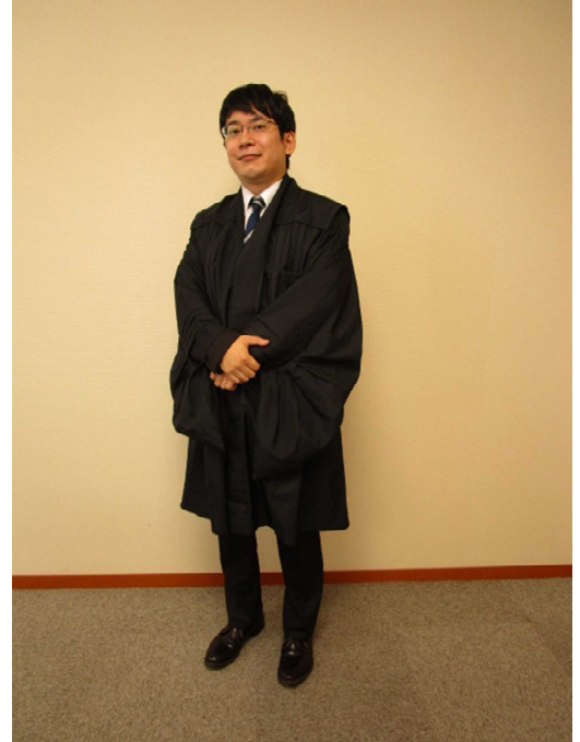
岡山地方裁判所第2民事部 橋本康平裁判官