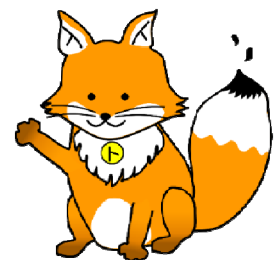
不動産登記推進イメージキャラクター トウキツネ

第4駐車場については、住宅地内にありますので、 「前向き駐車」・「アイドリングストップ」 による排気ガス防止に御協力をお願いします。