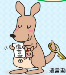
遺言書ほかんガル