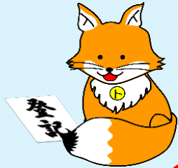
不動産登記推進 イメージキャラクター 「トウキツネ」