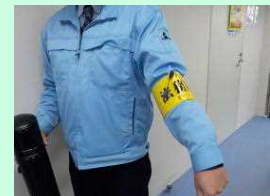
作業員が着用する腕章