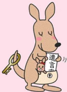
遺言書ほかんガルー

遺言書の内容については、 法律の専門家への相談 をお願いします。 遺言書保管申請の手続や書式は、 法務省ホームページ をご覧ください。