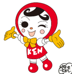
人権イメージキャラクター 人KEN あゆみちゃん