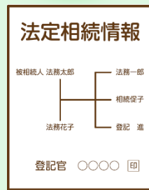
法定相続情報一覧図