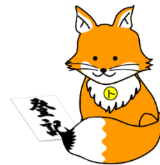
ふどうさんどうきすいしん 不動産登記推進 イメージキャラクター「トウキツネ」