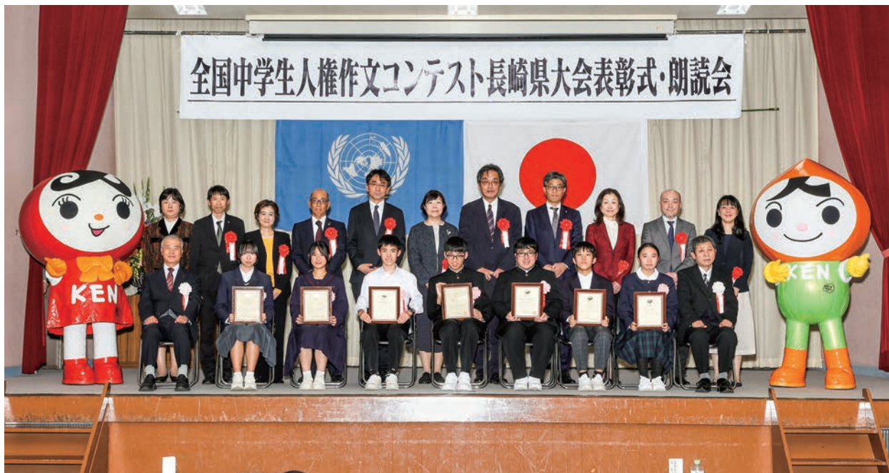
「第44回全国中学生人権作文コンテスト 長崎県大会表彰式」