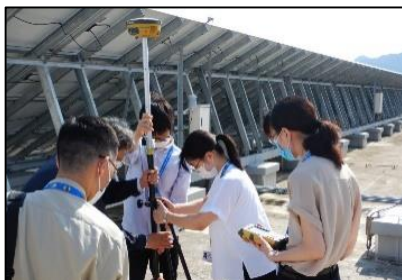
土地の境界測量作業の様子