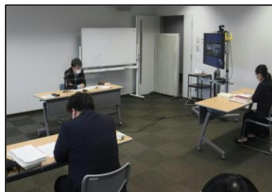
市町村職員を対象にした研修会