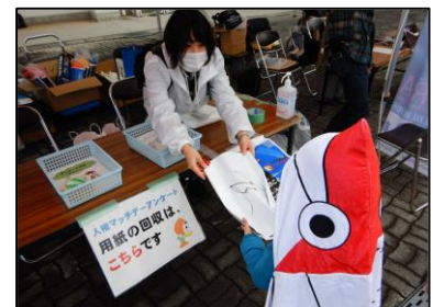
野外イベントでの人権啓発活動