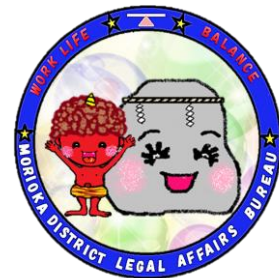
盛岡地方法務局ワークライフバランス推進キャラクター 鬼ねんくんと岩ってちゃん