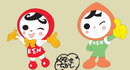
人権イメージキャラクター 人KENあゆみちゃん 人KENまもる君

国民の人権を擁護するために、相談・調査・救済・啓発等の活動を行って、全ての人々の人権が尊重される平和で豊かな社会の実現を目指しています。