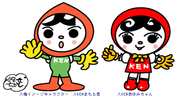
人権イメージキャラクター 人KENまもる君