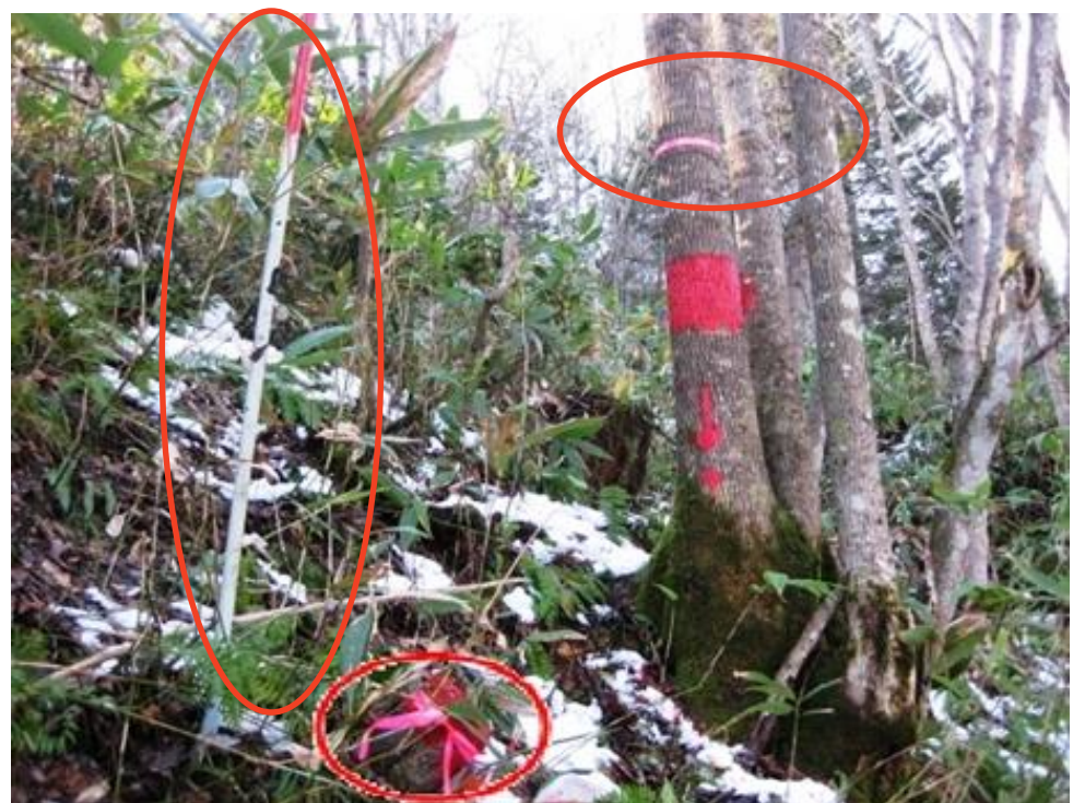
ポール、テープ類の例