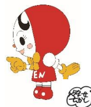
人権イメージキャラクター 人権あゆみちゃん