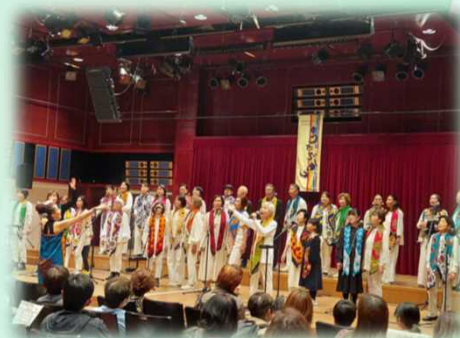
奈良市立富雄中学校吹奏楽部