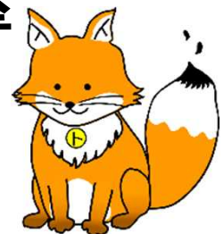
不動産登記推進 イメージキャラクター 「トウキツネ」