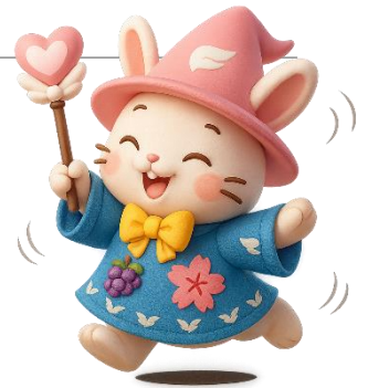
甲府地方法務局人権擁護課 オリジナルキャラクター 「ちゃっぴー」