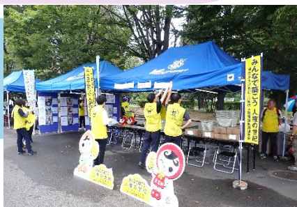
ヴァンフォーレ甲府 ホームゲームでの 啓発グッズ配布の様子

人権啓発事務については、ヴァンフォーレ甲府と協力した小瀬スポーツ公園での啓発グッズ配布や、人権を理解する作文コンテスト山梨県大会表彰式の運営など、さまざまな啓発活動を行いました。活動の企画調整を行い、円滑に行事を終えることができた際には、大きな達成感を感じました。