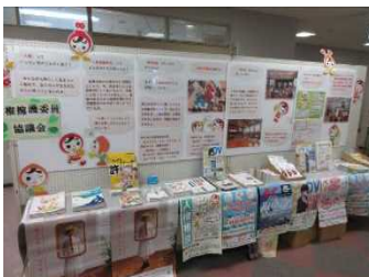
パネル展示の様子