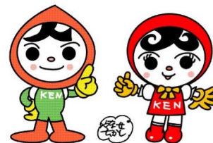
人権イメージキャラクター 人KENまもる君・人KENあゆみちゃん