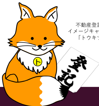
不動産登記推進 イメージキャラクター 「トウキツネ」

仕事をしていく中で法律知識を身につけることができ、様々な場面で対応できるようになり、一般の方から感謝される機会が増えました。また、上司や同僚から任される仕事が増えたときには、やりがいを感じています。