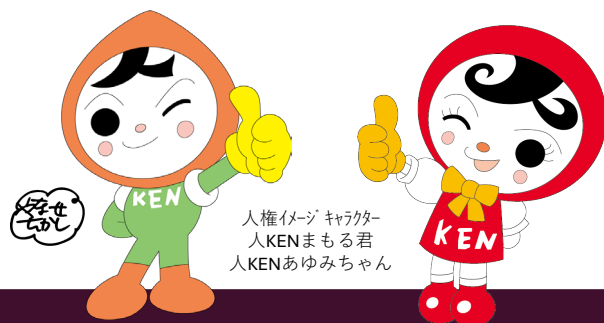
人権イメージキャラクター 人KENまもる君 人KENあゆみちゃん