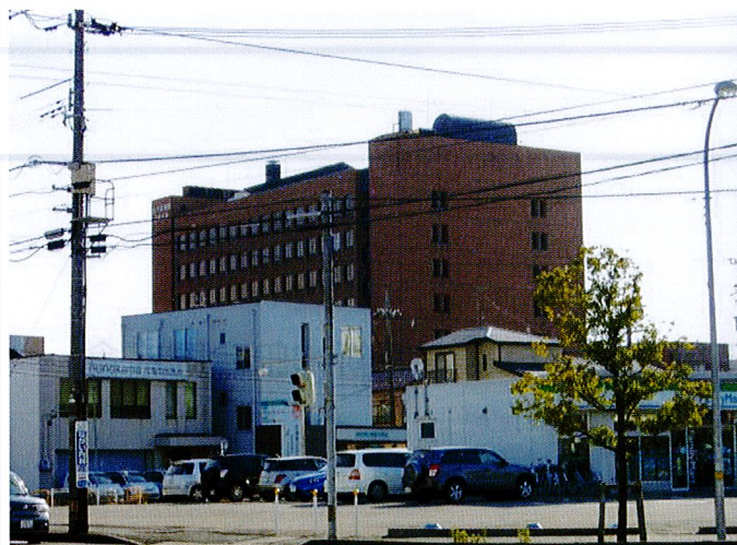
(新神田交差点から)