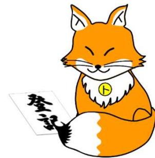
不動産登記推進イメージキャラクター 「トウキツネ」