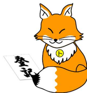
不動産登記推進イメージキャラクター 「トウキツネ」