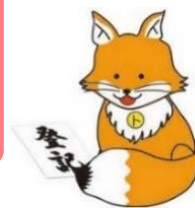
不動産登記推進イメージキャラクター「トウキツネ」