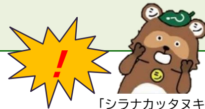
「シラナカッタヌキ」

義務化前（令和6年4月1日より前）に 相続したことを知った不動産は 令和9年 3月31日まで に必ず登記